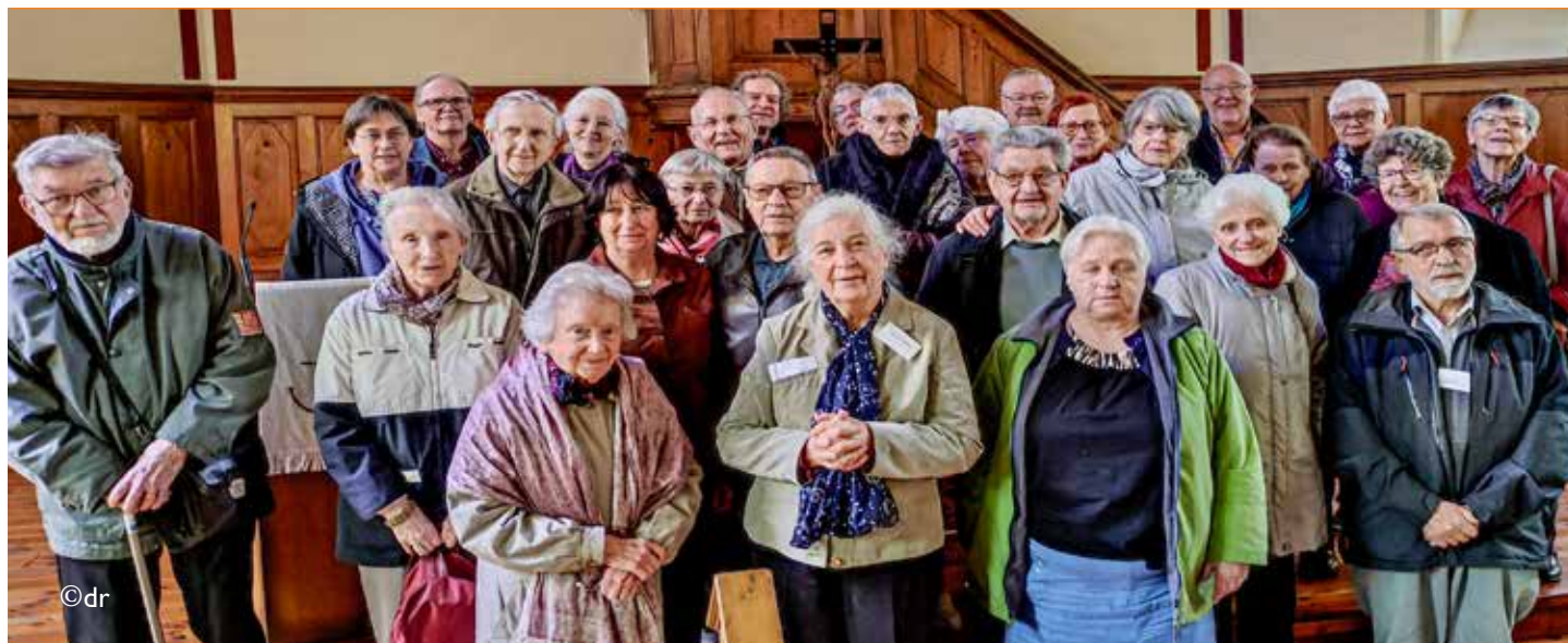
Les pasteurs retraités d'Alsace et Moselle dans le temple d'Oberbronn, le 16 mai 2023