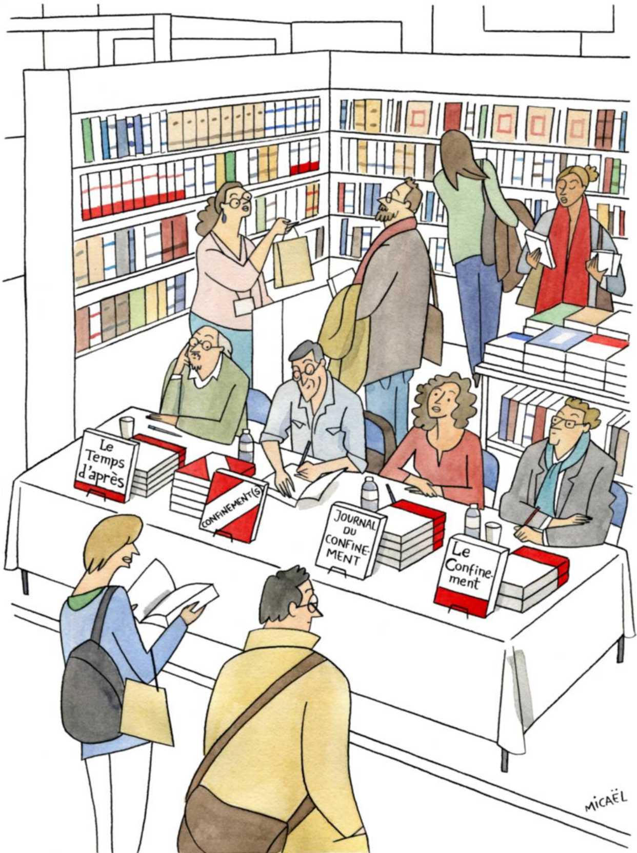
Salon du livre 2021