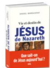
Vie et destin de Jésus de Nazareth Seuil, 416 p., 23 €.

Le risque absolu, en ce temps de sauve-qui-peut général, est le repli individualiste. La razzia sur les supermarchés trahit une peur de manquer et la tentation du repli sur soi. L'Évangile nous dit que c'est ensemble que nous serons sauvés. Hier, les jeunes défilaient dans les rues en demandant aux aînés : aidez-nous à sauver la planète. Aujourd'hui, les aînés demandent aux jeunes : aidez-nous à rester en vie. Nous serons sauvés ensemble. Les Églises pourraient être ces lieux où l'on cultive l'entraide, où l'on tisse des liens entre les gens et les générations. Plus que jamais, il apparaît que sur cette Terre, nous sommes confiés les uns aux autres. ☺